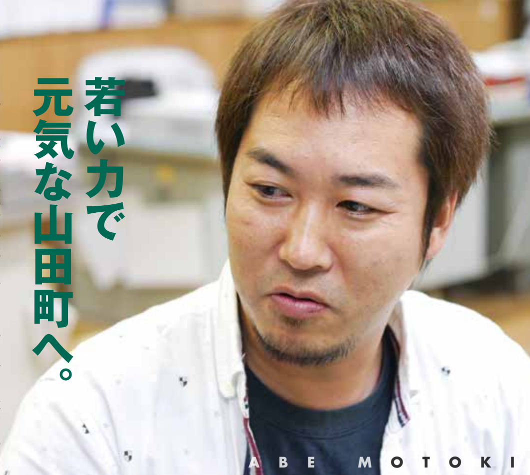
A B E M O T O K I