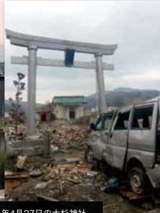
2011年4月27日の大杉神社。

津波にも耐えた大杉神社の鳥居。現在は社殿、神輿の早期復旧を目指し募金活動も行っています。