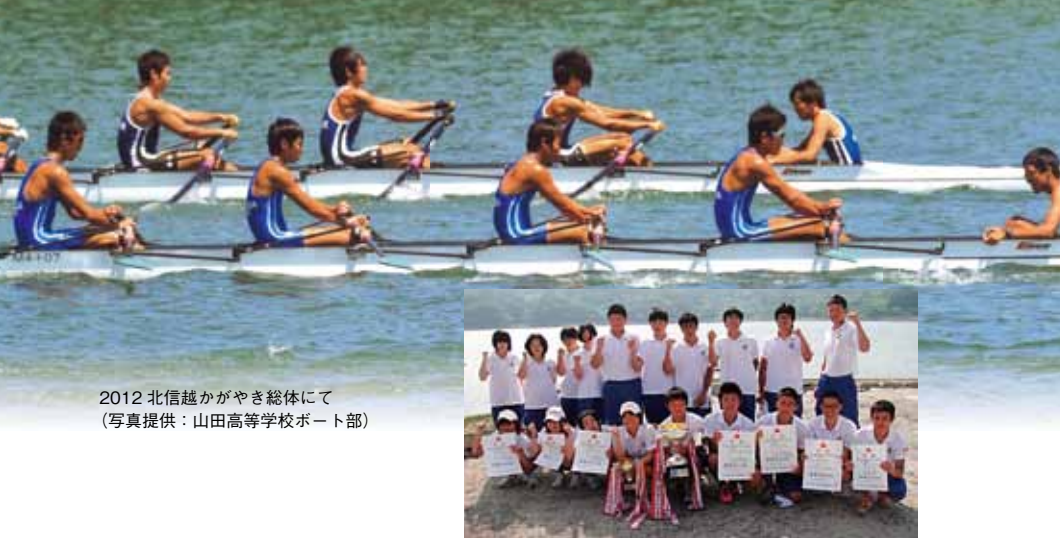
2012北信越かがやき総体にて