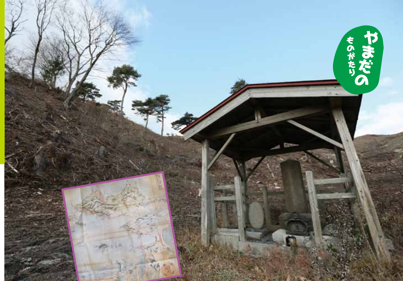
大沢地区袴田の、国道45号線沿いに佇む「六角塔」。鞭牛和尚が開削を始めて12年の成果を記念して建立。この地はかつて、大飢饉に苦しんだ人々を供養した地でもあります