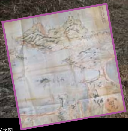
山田浦海岸之図 幕末に当地で活躍した絵師、佐々木藍田による下絵。 鞭牛和尚が拓いた街道が描かれています