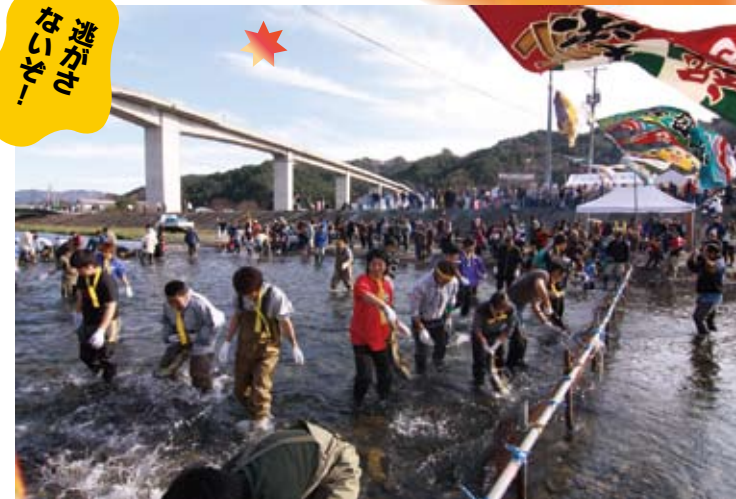
川でつかみ取りができるのはここ織笠川だけ。子どもも大人もずぶぬれになりながら、夢中で鮭を追いかけます