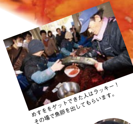
めすをゲットできた人はラッキー！その場で魚卵を出してもらいます。

織笠川では昔から鮭が豊富に獲れ、山田町をはじめ地域の人たちの生活を支えてきました。近年は、人工ふ化や稚魚の放流も積極的に行われ、毎年秋から冬にかけてたくさんの鮭が故郷の川へ戻ってきます。この鮭を山田の風物詩にしようと昭和55年から始まったのが、鮭まつり。例年、鮭のつかみ取りをはじめ、新鮮な魚介が味わえるコーナーが人気を集め、観光客も年々増えているイベントです。今年は、震災の影響や鮭の不漁で開催が危ぶまれましたが、「町に活気を！」との思いから、名称を変えて開催が決定されました。