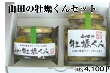
山田の牡蠣くんセット 価格 4,100 円

牡蠣の燻製をオリーブオイル漬けした絶品グルメ。酒のつまみやパスタの具材に！大瓶1本、小瓶1本