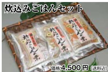
炊込みごはんセット 価格 4,500 円 (送料込)

昆布やサバ節などの魚介だしがしっかり利いた炊き込みご飯の素。ホタテの風味が豊かに香り、心までほっこり温まります。ホタテ、サケの2種類から3バック選択