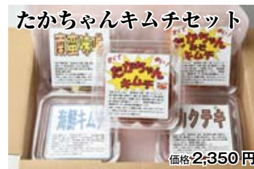
たかちゃんキムチセット 価格 2,350 円

老舗の漬物屋さんが自宅用に作ったキムチが口コミで人気に。日本の食卓にあう味です。キムチ、カクテキ、みそキムチ、南蛮味噌、海鮮キムチ