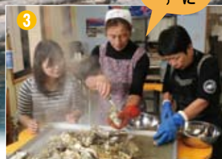
どんどんむいてくれるので、ひたすら食べるだけ！何もつけなくても濃厚な味！