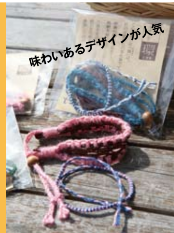
味わいあるデザインが人気