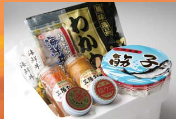
山田 海のご馳走セット