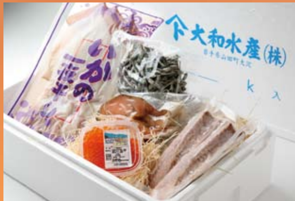
三陸山田の美味尽くし

豊かな山田湾で獲れた海の幸。清らかな自然の中で育った山の幸。古くから愛されてきた味覚を厳選して、山田尽くしの特別セットを用意しました。年の瀬のご挨拶がわりに、大切なあの方へ贈りませんか。