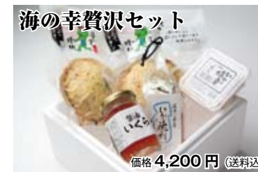
海の幸贅沢セット 価格 4,200 円 (送料込)

TEL 0198-29-5720 / FAX 0198-29-5721 (花巻加工場)