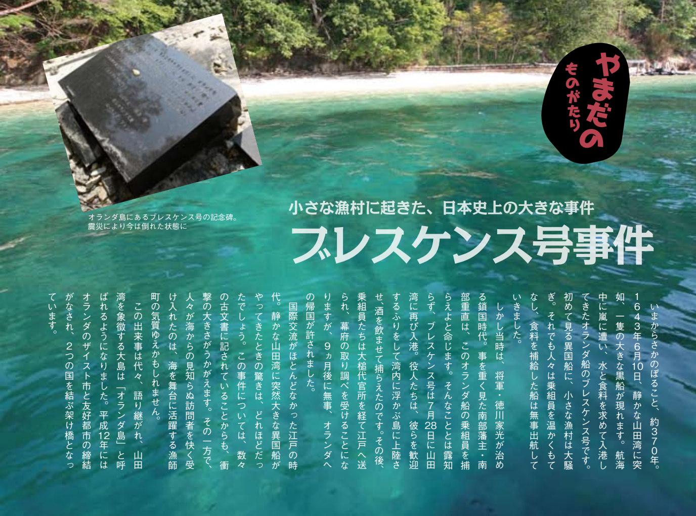
オランダ島にあるブレスケンス号の記念碑。 震災により今は倒れた状態に