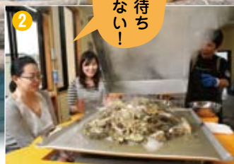
フタを開けると真っ白い蒸気が。鉄板には牡蠣のエキスがたっぷり！