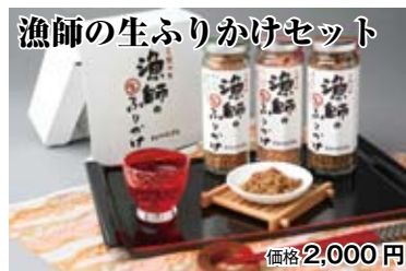
漁師の生ふりかけセット 価格 2,000 円

帆立貝ひもやアミ小エビを使ったしっとりふりかけ。鮭フレークは炙り鮭で香ばしく。漁師の生ふりかけ、芽椎茸入り、さけフレーク