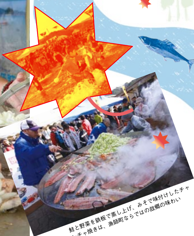
鮭と野菜を鉄板で蒸し上げ、みそで味付けしたチャンチャ焼きは、漁師町ならではの故郷の味わい