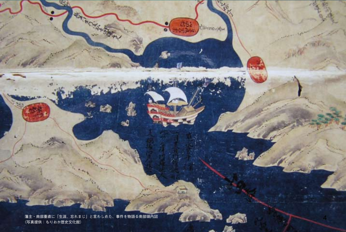
藩主・南部重直に「生涯、忘れまじ」と言わしめた、事件を物語る南部領内図

いまからさかのぼること、約370年。1643年6月10日、静かな山田湾に突如、一隻の大きな黒船が現れます。航海中に嵐に遭い、水と食料を求めて入港してきたオランダ船のブレスケンス号です。初めて見る異国船に、小さな漁村は大騒ぎ。それでも人々は乗組員を温かくもてなし、食料を補給した船は無事出航していきました。 しかし当時は、将軍・徳川家光が治める鎖国時代。事を重く見た南部藩主・南部重直は、このオランダ船の乗組員を捕らえよと命じます。そんなことは露知らず、ブレスケンス号は7月28日に山田湾に再び入港。役人たちは、彼らを歓迎するふりをして湾内に浮かぶ島に上陸させ、酒を飲ませて捕らえたのです。その後、乗組員たちは大楯代官所を経て江戸へ送られ、幕府の取り調べを受けることとなりますが、9か月後に無事、オランダへの帰国が許されました。 国際交流がほとんどなかった江戸の時代。静かな山田湾に突然大きな異国船がやってきたときの驚きは、どれほどだったでしょう。この事件については、数々の古文書に記されていることから、衝撃の大きさがうかがえます。その一方で、人々が海からの見知らぬ訪問者を快く受け入れたのは、海を舞台に活躍する漁師町の気質ゆえかもしれません。 この出来事は代々、語り継がれ、山田湾を象徴する大島は「オランダ島」と呼ばれるようになりました。平成12年にはオランダのザイスト市と友好都市の締結がなされ、2つの国を結ぶ架け橋となっています。