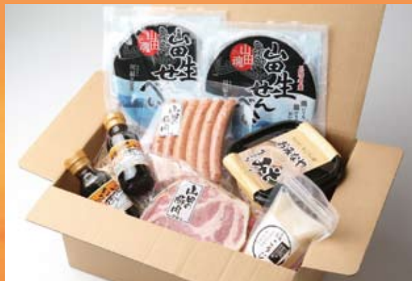
山田 里の恵みセット