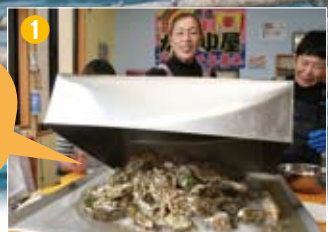
大きな鉄板の上に大量の殻つき牡蠣を豪快に盛り、フタをします。