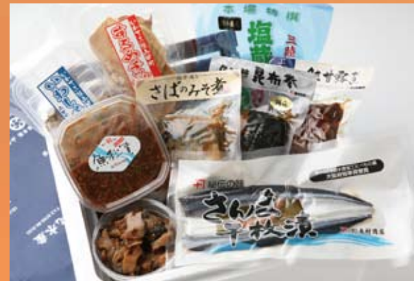
五篤の珍味セット